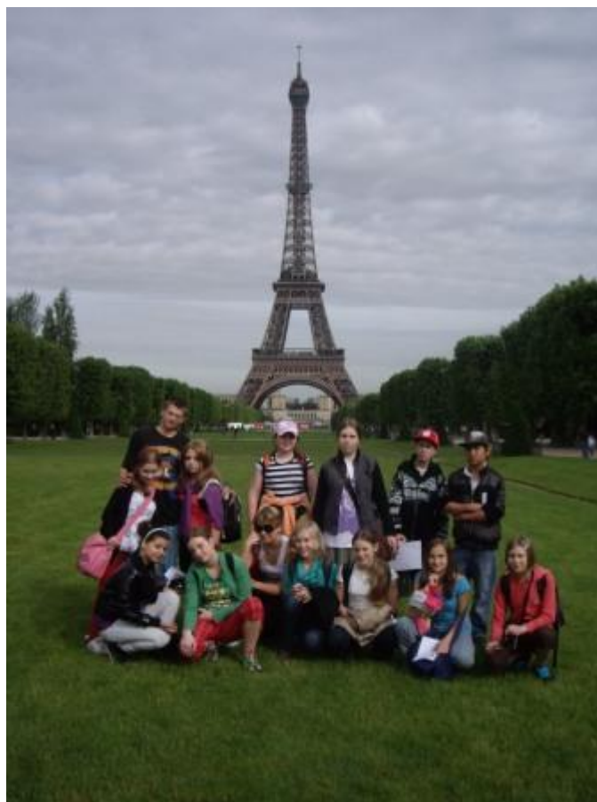
Výlet do Paříže, 2009